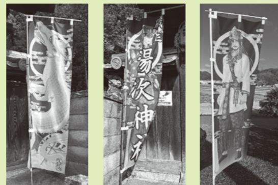
りゅうごん様 湯次神社神様 多賀神社神様