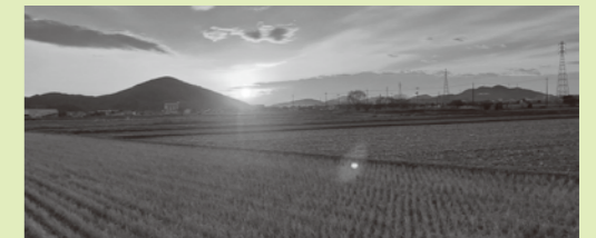
磯上平野の夕日は、まことに美しいですネ♡