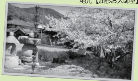
地元【油杉お大師堂】

予算につきましては、後ほど説明させていただいておりますので、お読みください。今後も、しっかり取り組んでまいります。皆さまには本当にいつも、温かく見守っていただき、そして励ましていただき本当にありがとうございます。私はいつも、皆さまの声を市政に届けていきたい、その思いでいます。その思いは、今もこれからも変わることはありません。引き続き力強いご支援の程、よろしくお願い申し上げます。