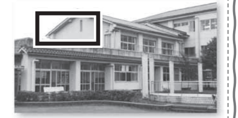
★ 国府小学校 ★

ちなみに、右は国府小学校の校舎です。現在支援の必要な子どもたちの教室が3つあり、来年には、不足することが見込まれています。四角く囲った部分が、最良の増設スペースだと思っております。